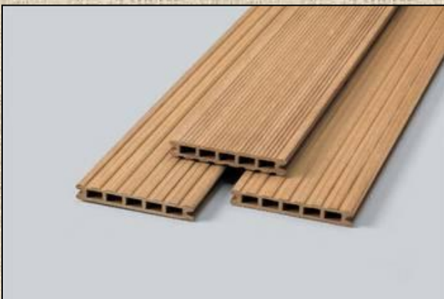
WPC lightoak (světlý dub)