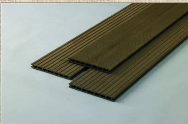
WPC marone (kaštanová)